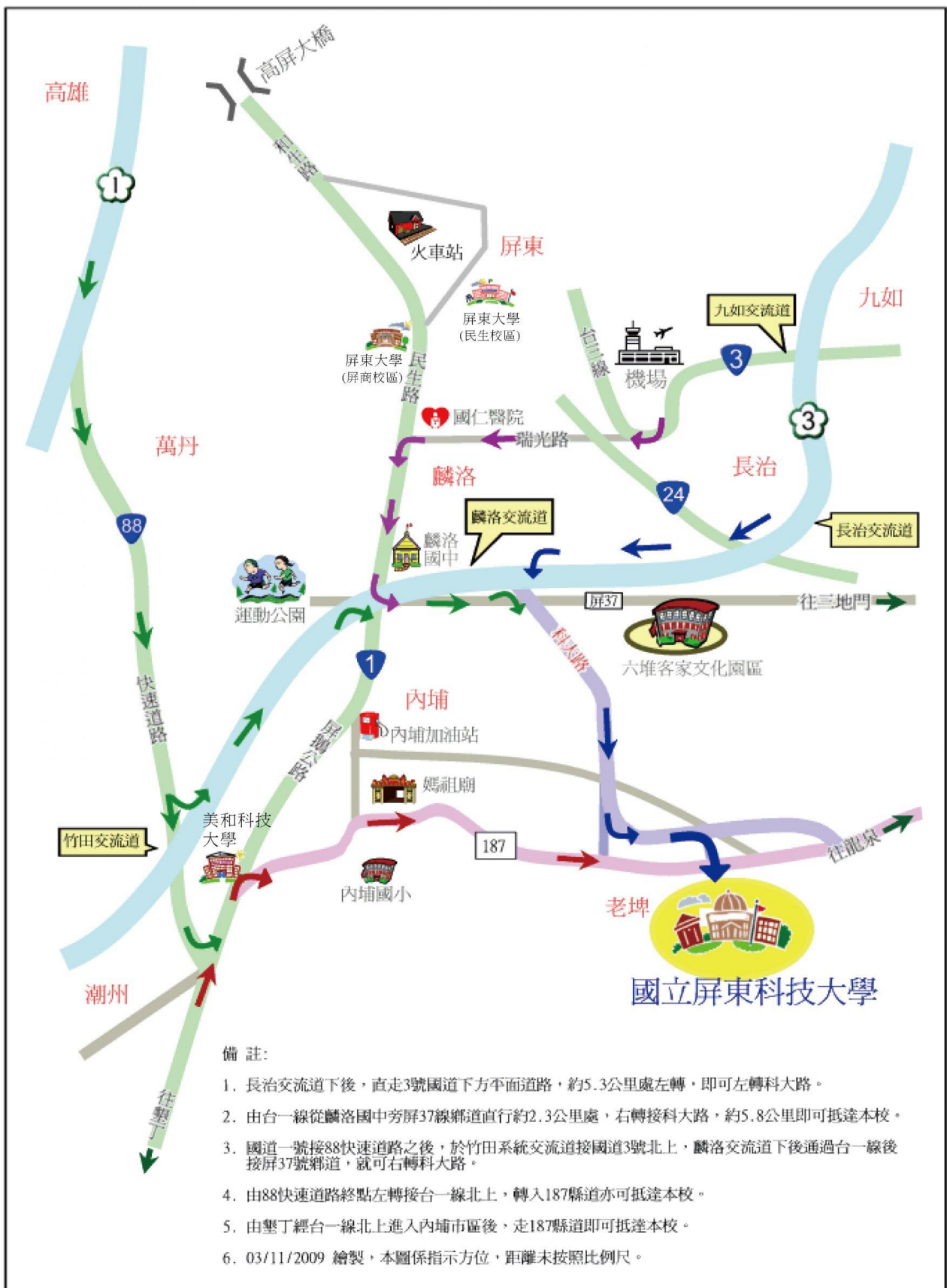
國立屏東科技大學位置示意圖