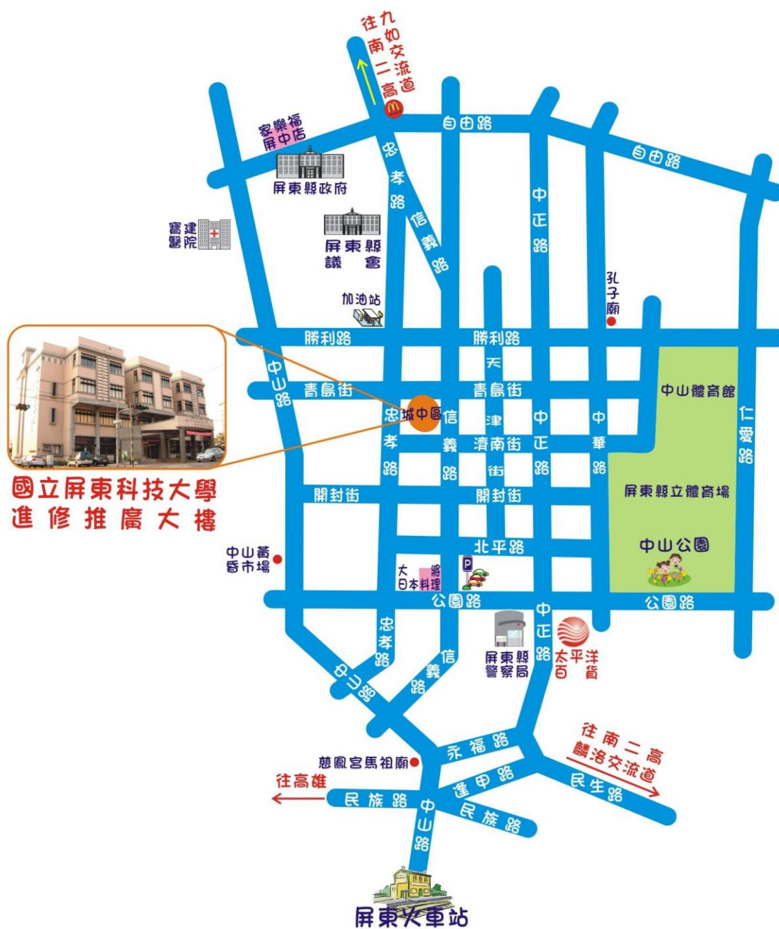
國立屏東科技大學 進修推廣大樓