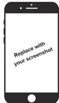
Step 6: (fill in description)