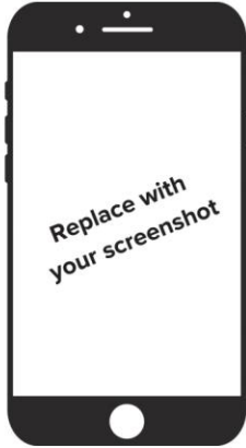
Step 4: (fill in description)