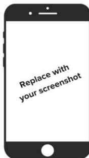
Step 2: (fill in description)