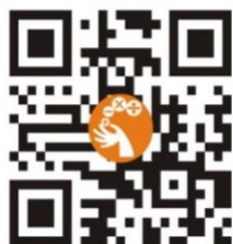
中華數學協會官網