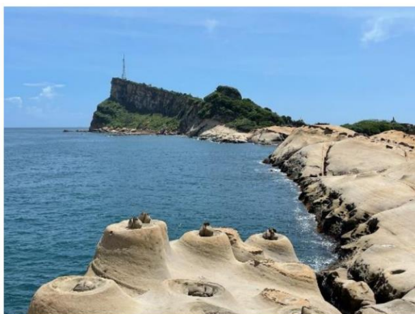
圖 1 台灣地景保育網任選一張地景的照片或自行拍攝或選用照片(請務必註明出處)