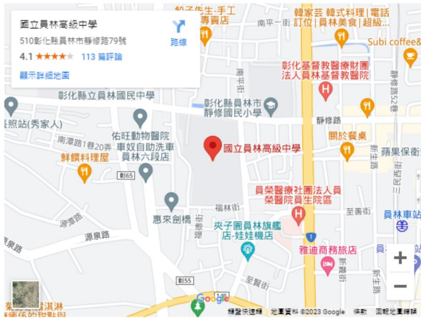
員林高中校園平面圖