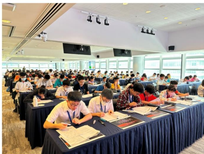
※2023 年 GMEC 總決賽現場