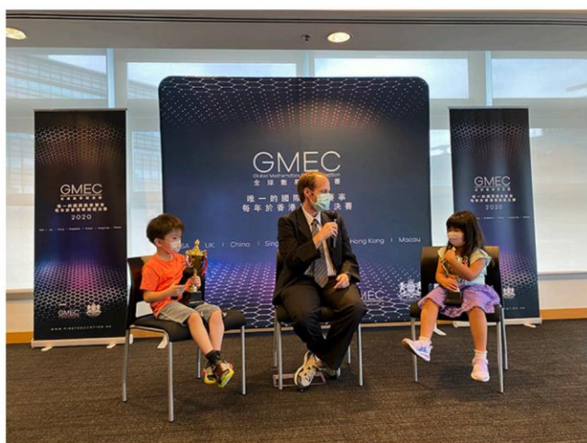
※2020 年 與教授的一席話

2. AoPS 遊學團獎金：全球冠軍將獲得參加 AoPS 遊學團的全額獎學金。（僅包含課程）