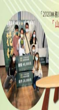
入選 「2020林務局國產材設計商品徵選活動」 「山林相連Formosa」