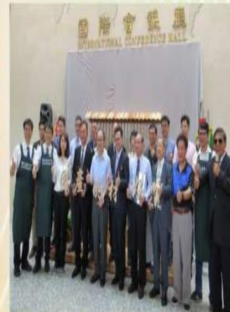
「木質層積材創意商品推廣發表會」推廣國產 材的好