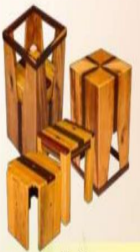
榮獲 「2015商業木材創意競賽」 全國第二名「聚.1>3」