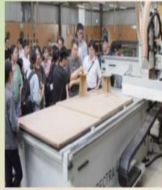
木材利用工廠接受企業捐贈1部CNC加工機

● 辦理海外職場專業實習每年選派大四下應屆畢業生，前往越南家具廠進行現場教學實習2~3個月，落實產學合一，學以致用，畢業即就業。