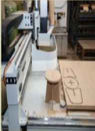
CNC加工機裝機完成後實際操作情形