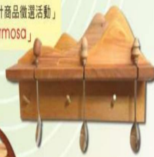
榮獲 「第一屆國產木材設計競賽」 佳作「虹」