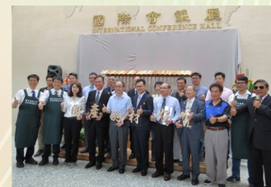
「木質層積材創意商品推廣發表會」推廣國產材的好