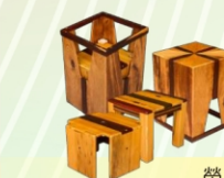
榮獲「2015廢棄木材創意競賽」全國第二名「聚。1>3」