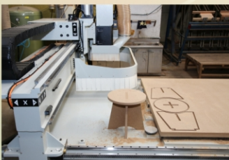
CNC加工機裝機完成後實際操作情形