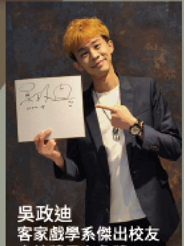
吳政迪 客家戲學系傑出校友 金鐘獎男主角獎、 兒少節目主持人獎得主