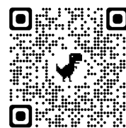
地科入門推廣研習宣傳影片