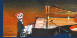
MUSICGEN 透過文字提示生成音樂