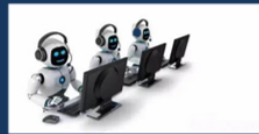
OPENVOICE 僅需10秒樣本即可語音複製