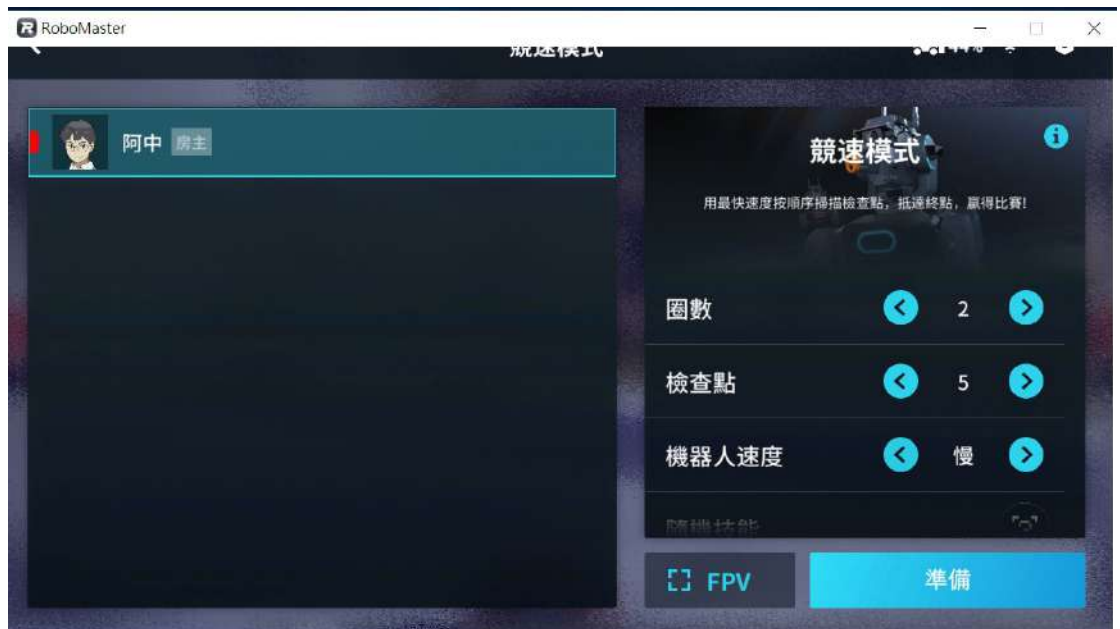
[圖四] RoboMaster程式；競速模式示意圖