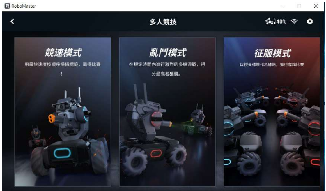
[圖三] RoboMaster程式；競速模式示意圖

(一) 啟動 RoboMaster 程式，進入多人競賽、競速模式。(如圖三、圖四)