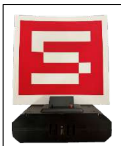
[圖二] 固定標靶示意圖