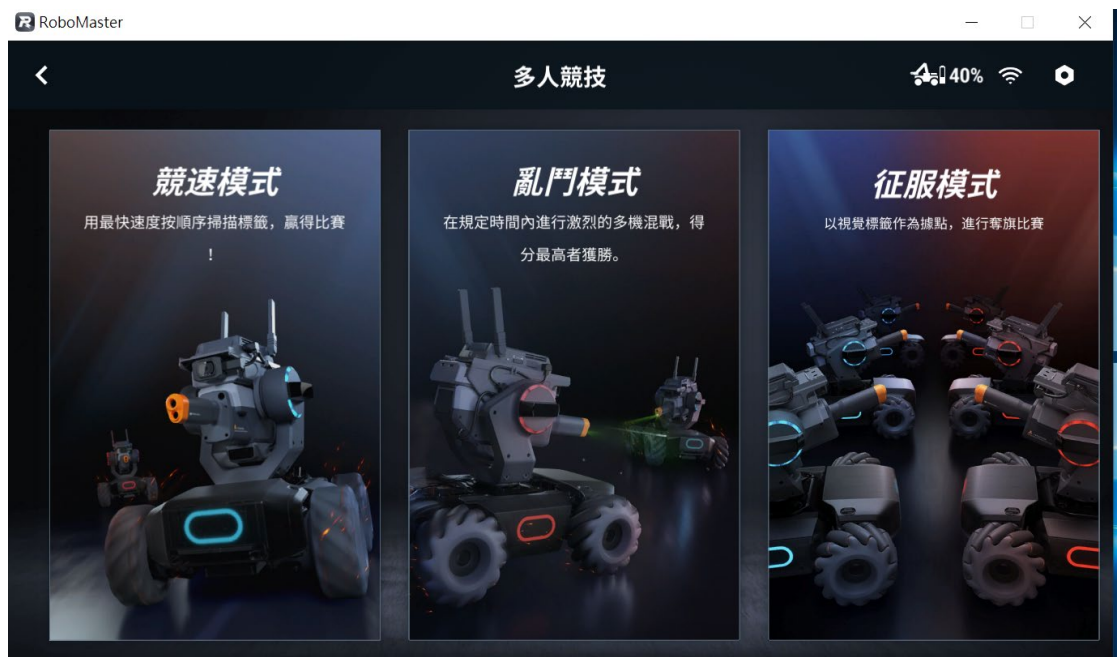
[圖三] RoboMaster程式；競速模式示意圖

(一) 啟動 RoboMaster 程式，進入多人競賽、競速模式。(如圖三、圖四)