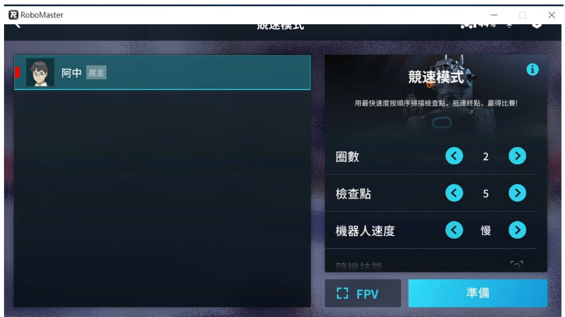
[圖四] RoboMaster程式；競速模式示意圖