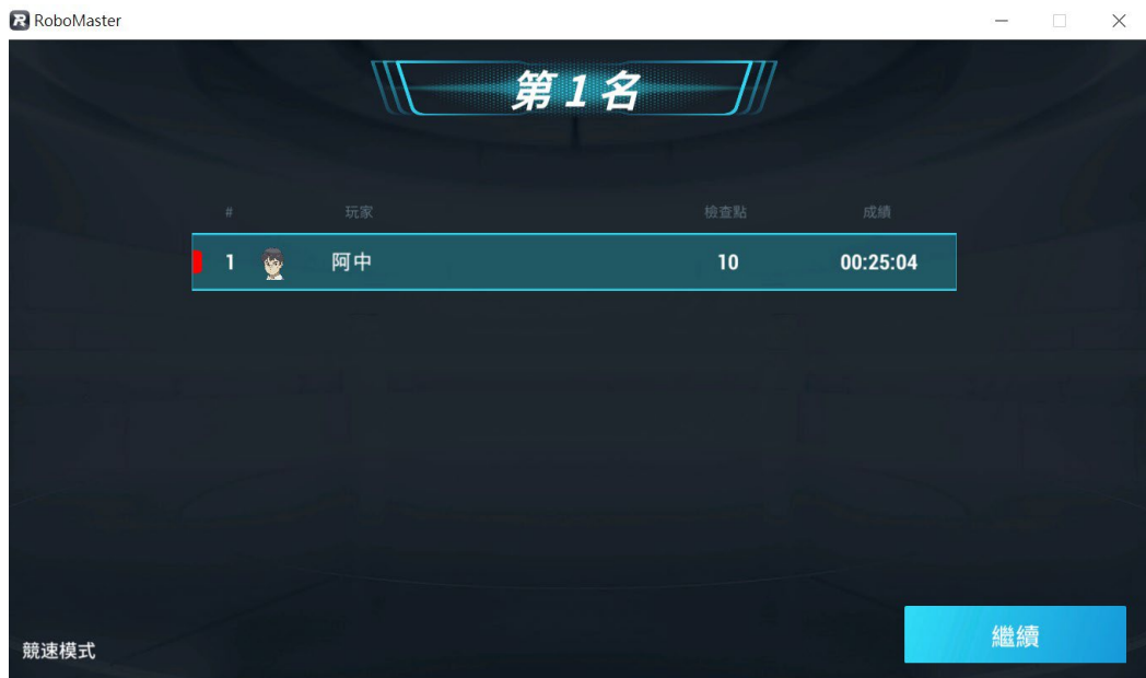
[圖六] 競速模式分數顯示示意圖