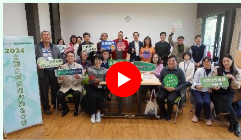
點擊回顧 2024 全國企業倫理教師夏令營

本次營隊期藉由 大師專題 、 生成式AI 、 學思達教學 、 個案與角色扮演 、 互動教學 、 企業倫理桌遊 、 公司治理實務與企業倫理對話 等創新教學方法，同時透過兩天實體營隊交流與分享，帶領學員夥伴精進企業倫理教學與應用，減少授課心態與教材準備的摸索時間。