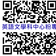
英語文學科中心粉專

(七)研習聯絡人：普通型高級中等學校英語文學科中心(高雄市立左營高級中學專任助理蘇小姐，TEL：07- 5822010 轉 120、07-585-5102，E-mail： english026@gmail.com 。