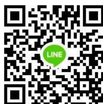
競賽 Line 群組