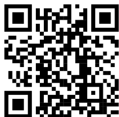
線上報名 QR code