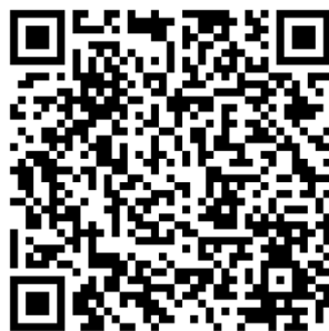
競賽報名 GOOGLE 表單

(二) 報名資料於 113 年 10 月 17 日 (星期四) 23:59 前填妥 Google 表單，含上傳授權同意書(附件一)、個資收集告知事項(附件二)及學生證正反面。