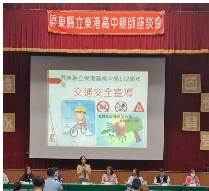
東港高中112學年度第一學期9月16日親師座談會(交通安全宣導)