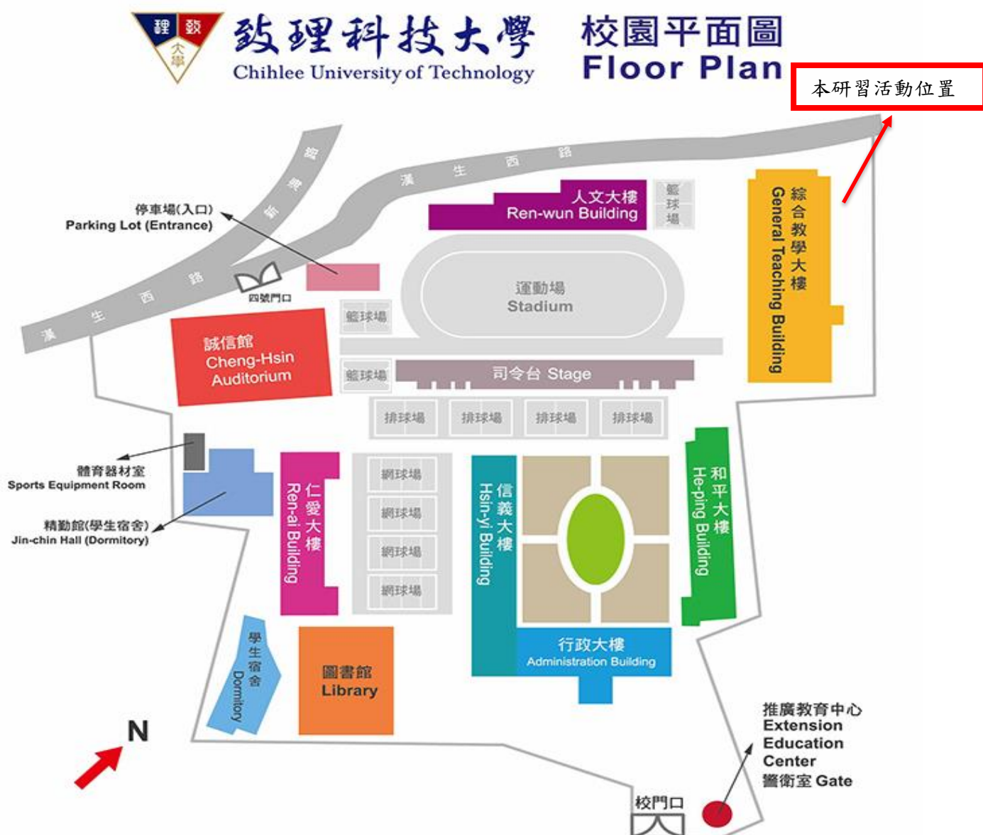
致理科技大學校園平面圖

2.經高速公路國道三號（北二高）中和交流道下，往板橋方向出口，接 64 號快速道路（西向），往萬板路出口方向下橋，直行民生路至迴轉道迴轉往文化路方向，右轉文化路直行，即可到達。