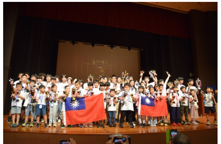
※2024 年 台灣代表隊