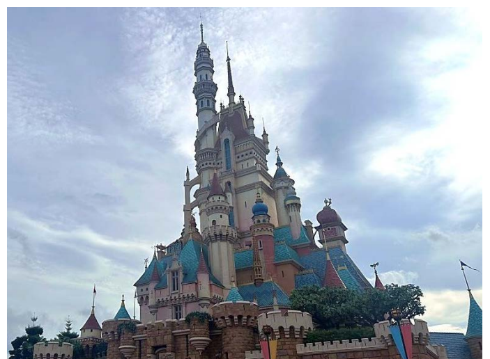
※2024 年 前進香港迪士尼