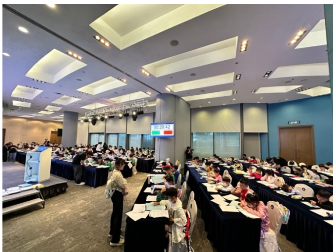
※2024 年 GMBC 總決賽現場