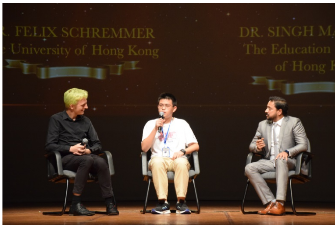
※2024 年 與教授的一席話

2. AoPS 遊學團獎金：全球冠軍將獲得參加 AoPS 遊學團的全額獎學金（僅包含課程）。