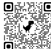
地科入門推廣研習宣傳影片