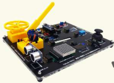
5016B 智慧數控教學平台