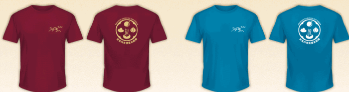
21 KM / 12 KM