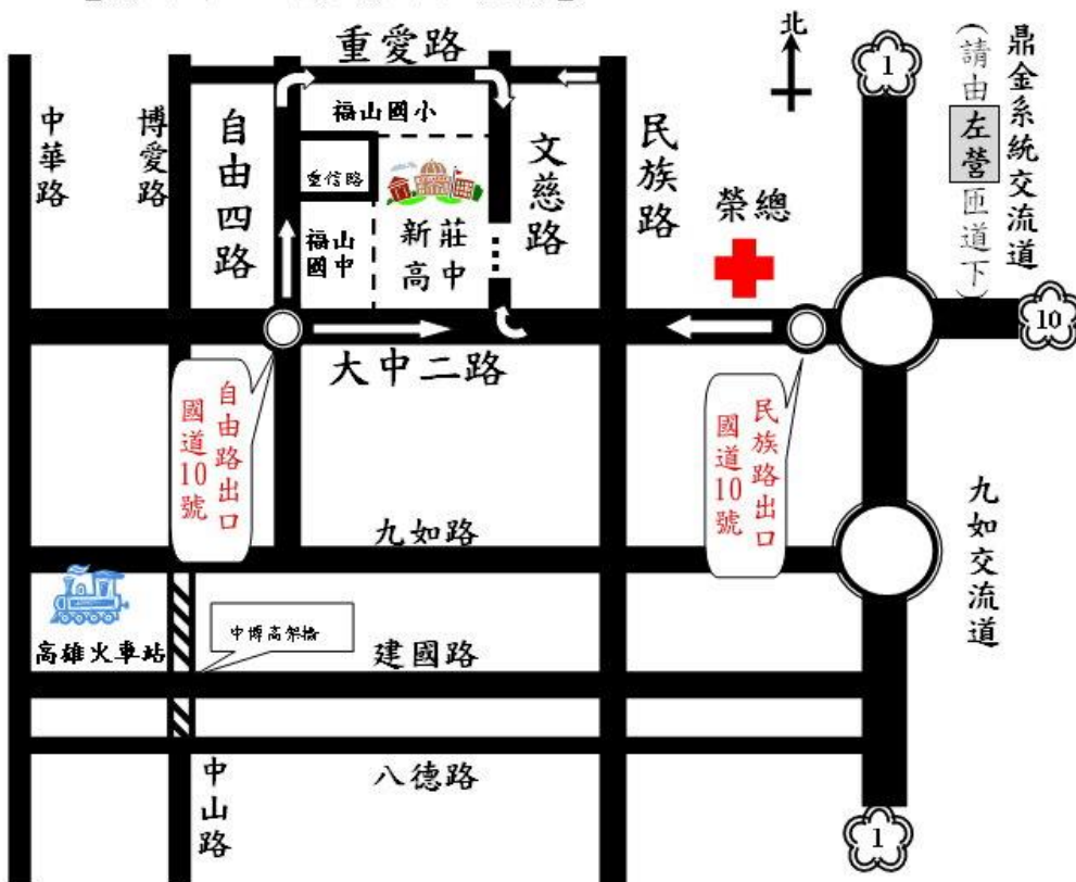
【高雄市立新莊高中位置圖】