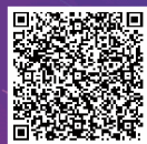
研討會官網報名網址