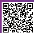
Conference Paper Submission Form