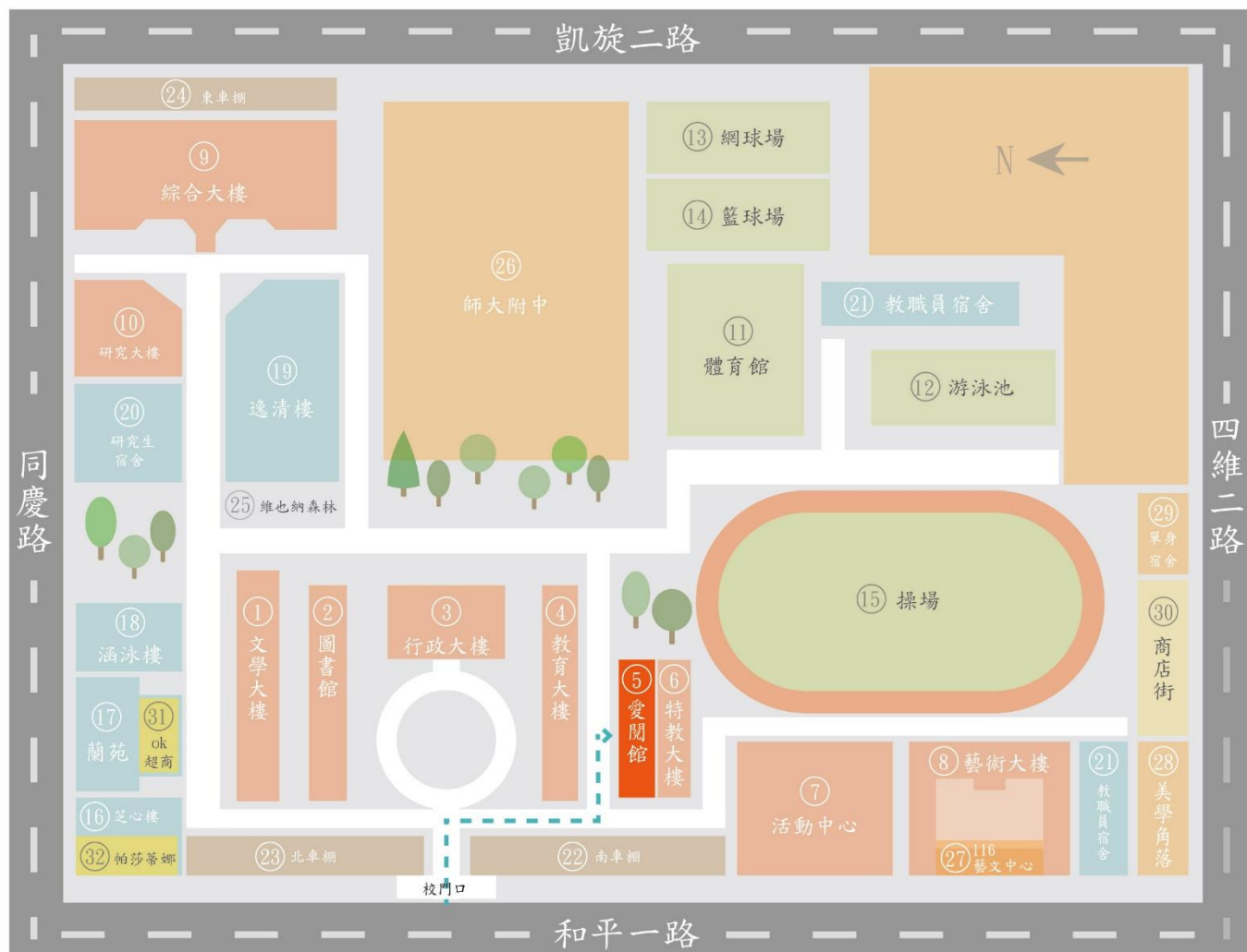
國立高雄師範大學和平校區校園平面圖