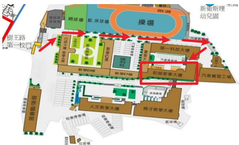
(臺中市立僑泰高級中學校內地圖)