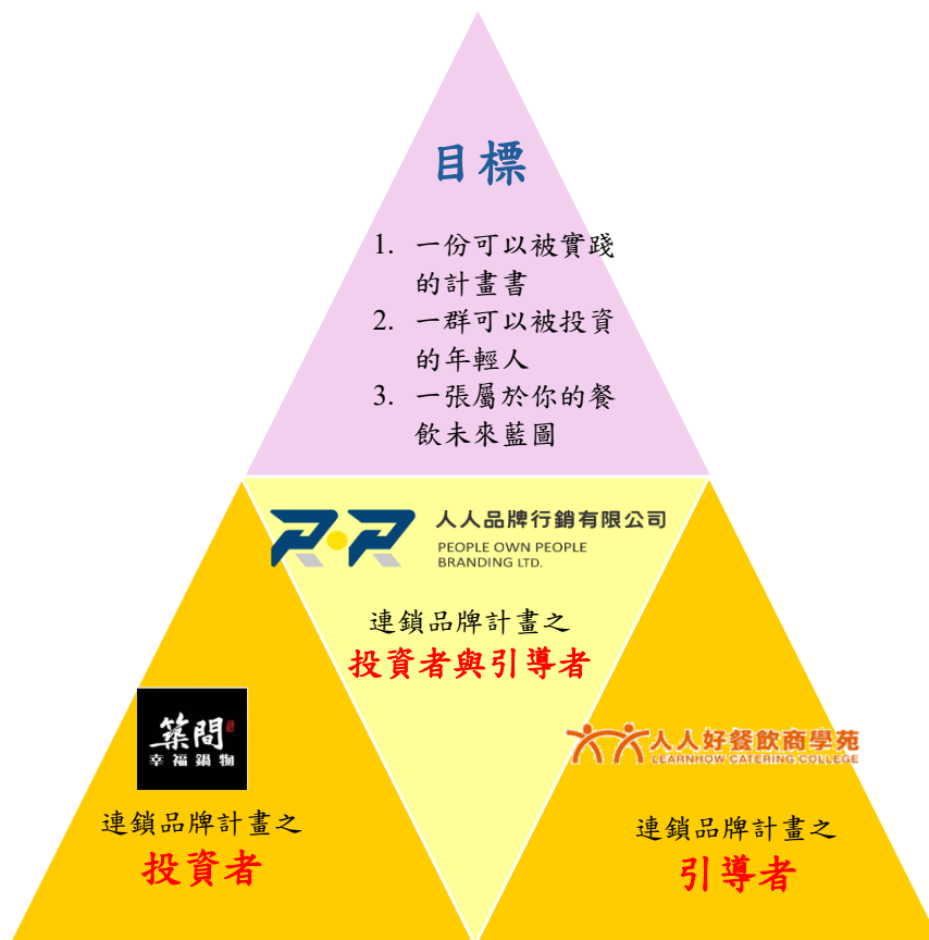
圖 1 選出具可行性與未來性的餐飲計畫之競賽合作夥伴鐵三角圖

圖 1 為「餐飲計畫競賽合作夥伴鐵三角圖」，說明具備可行性與未來性的計畫如何透過三方合作實現目標。頂端為「目標」，本競賽為年輕人創造一個平台，讓其發揮可實踐的計畫書、可被投資的年輕人，以及勾勒屬於年輕人的未來藍圖。底部三角代表本競賽的合作角色： 引導者 （人人品牌行銷與人人好餐飲商學苑）、 投資者 （人人品牌行銷與築間餐飲集團）透過這三方合作，選出具潛力的連鎖品牌計畫，推動年輕人創業計畫落地實現。