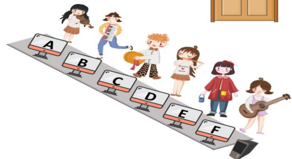
比賽現場 參賽者站位圖