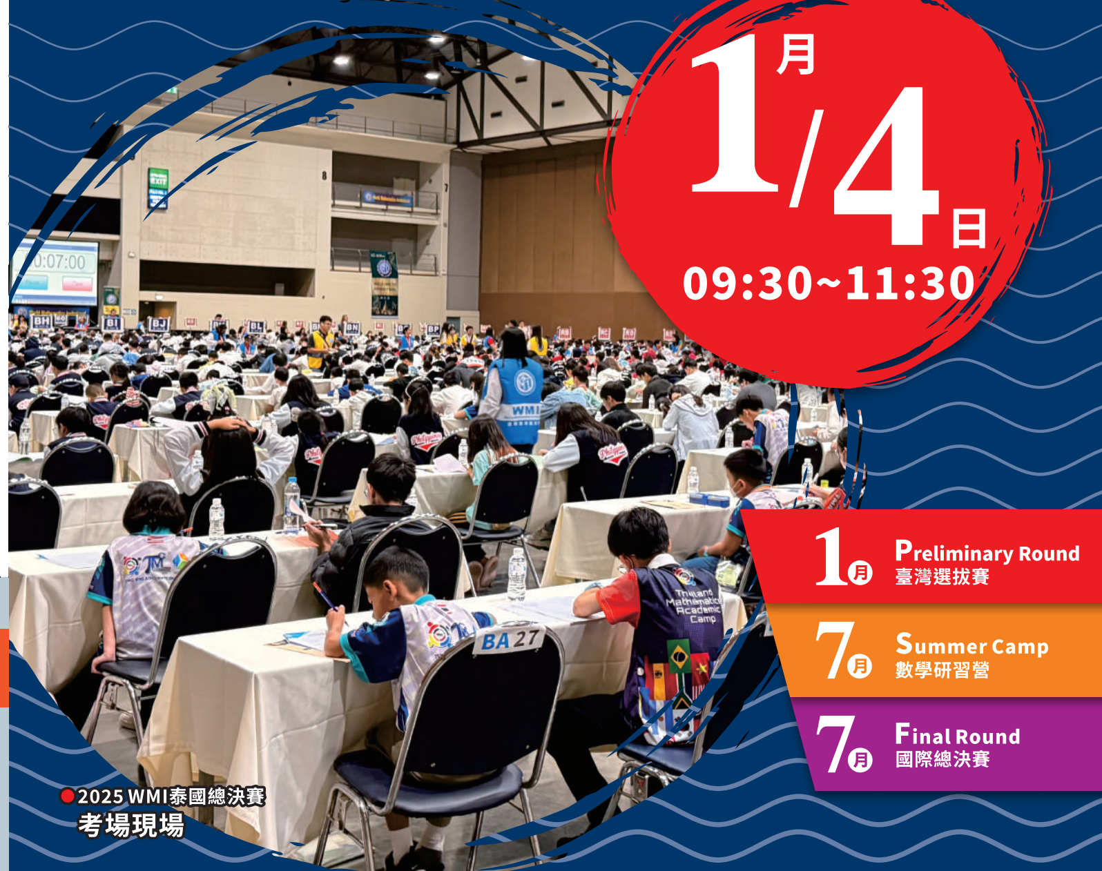
● 2025 WMI泰國總決賽 考場現場