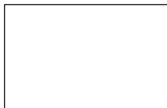
圖 1 XX