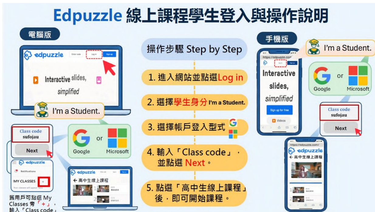
圖 Edpuzzle 線上課程學生登入與操作流程