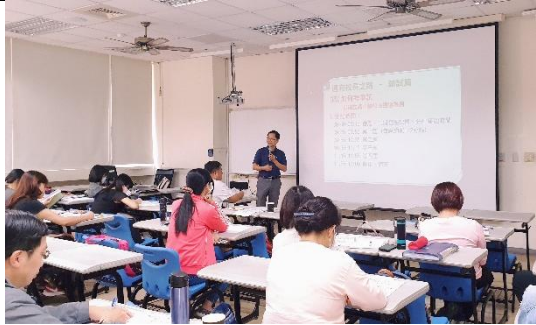
資深校長經驗分享