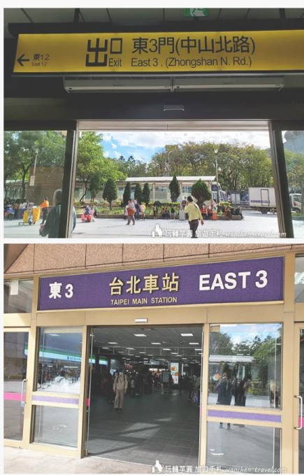
搭配台北車站顏面圖位置