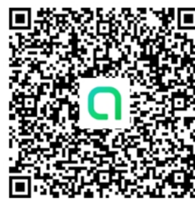
數位化科學競賽 Line 社群