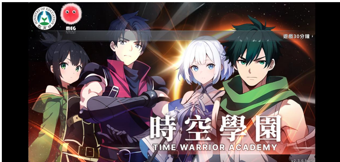
《時空學園》遊戲畫面：